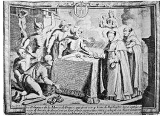
Het terugkopen van christenen in Barabarijse landen door katholieke monniken

Het westelijke deel van de Barbarijse gebieden viel onder de heerschappij van de Marokkaanse dynastieën en het oostelijke deel van de Barbarijse gebieden viel onder de heerschappij van het Ottomaanse Rijk, maar genoot officieus een grote autonomie. Op de slavenmarkten aldaar werd gehandeld in uit Europa en Sub-Saharaans Afrika gehaalde mensen. Er werd geen onderscheid gemaakt naar ras of religie; slaven in Noord-Afrika konden zowel zwart zijn, bruin of wit; christen, jood of moslim. De Europese slachtoffers werden aangevoerd door piraten vanuit de kustplaatsen van Italië, Spanje, Portugal, Frankrijk, Engeland tot zelfs IJsland toe. Mannen, vrouwen en kinderen werden gevangengenomen in zulke mate dat sommige kuststreken ontvolkt werden.