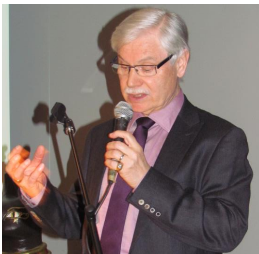
De auteur van de Kwartierstaat: Noël Boussemaere